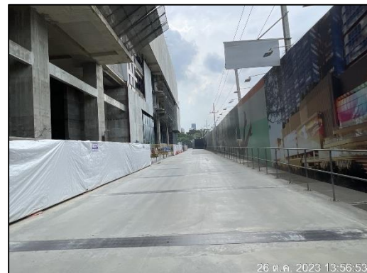
ภาพที่ 1.6-1 สถานภาพการก่อสร้างโครงการในปัจจุบัน